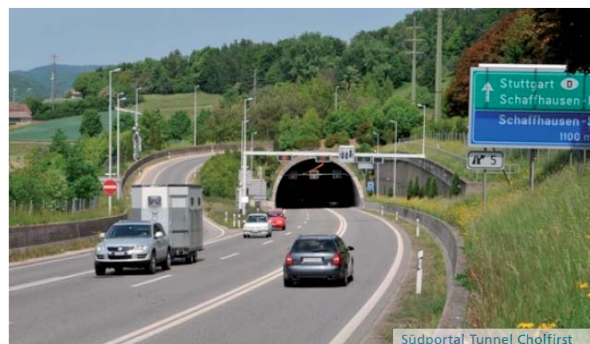
Südportal Tunnel Cholfirst

Gemäss dem Bundesamt für Strassen „ASTRA“, überzeugte unser Angebot insbesondere durch die hervorragende Qualität der Schlüsselpersonen und konnte sich gegen 5 weitere Mitbewerber erfolgreich durchsetzen. Das Projekt startet im 2. Quartal 2013, hat eine Laufzeit von ca. 4 Jahren, einen Auftragswert von rund 1.86 Millionen Franken und zählt zu einem der grössten Aufträge in unserer Firmengeschichte.