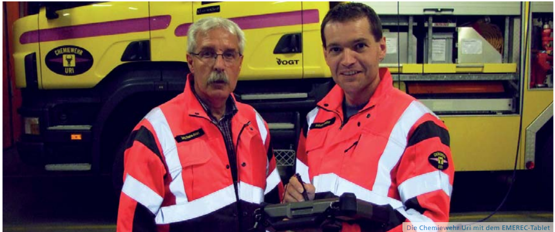
Die Chemiewehr Uri mit dem EMEREC-Tablet

Die Ecosafe Gunzenhauser AG ist stolz darauf, die Chemiewehr Uri bei ihren Einsätzen unterstützen zu dürfen. Lesen Sie im Interview, weshalb EMEREC ein unverzichtbares Tool in der Einsatzbekämpfung ist.