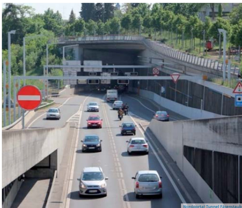
Nordportal Tunnel Fäsenstaub

Mit dem Zuschlag für die Erstellung der Rettungskonzepte: „Tunnel und offene Stecke in der Gebietseinheit VII“, startete die Ingenieurgesellschaft „INGE EJ“, bestehend aus der Ecosafe Gunzenhauser AG und der Jauslin+Stebler Ingenieure AG, mit einer grossen Herausforderung ins neue Jahr.